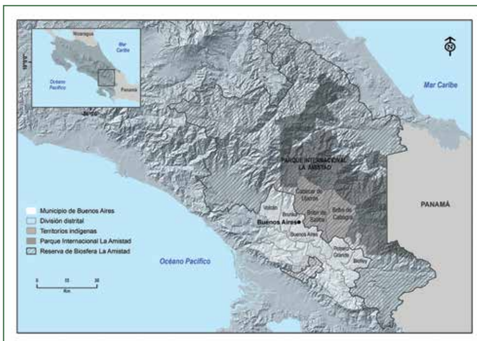
Mapa 1. Área de estudio, Reserva de Biosfera La Amistad