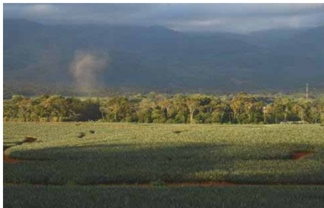
Plantación de piña en la zona de amortiguamiento de la Reserva de Biosfera La Amistad. ■ F. González Brenes

a emplearse de forma precaria en la agroindustria piñera, tanto en la plantación como en las plantas de empaque y procesamiento de la fruta, con lo que la actividad agrícola familiar ha quedado relegada a un segundo plano o ha sido del todo abandonada. Este cambio en el sector de ocupación y las condiciones del empleo en la agroindustria han tenido repercusiones socioeconómicas negativas en muchas familias de la región que se reflejan en un pobre equilibrio entre los modelos de desarrollo regional, una pobre atención al modelo endógeno y el favorecimiento del modelo exógeno.