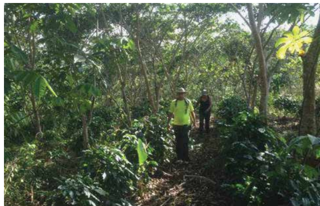
Parcela bajo sistema agroforestal con café, plátano y árboles Inga en el territorio indígena de Cabagra.

La implementación de iniciativas productivas en la modalidad de agroforestería en pequeñas parcelas ha permitido aumentar la cobertura boscosa en más de 152 hectáreas,