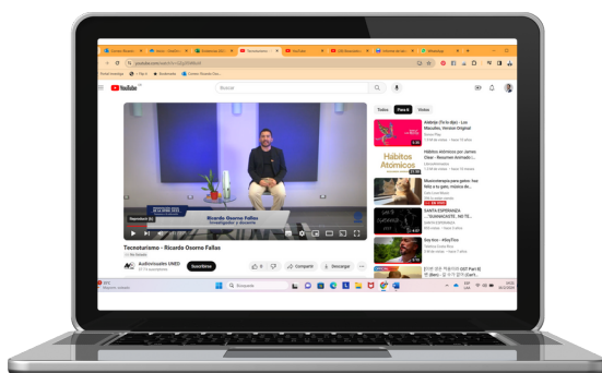
Experiencia de cocreación de un podcast educativo