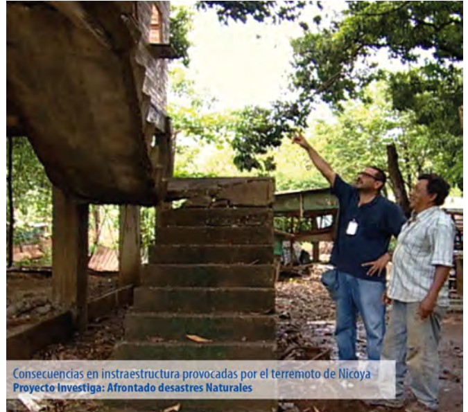
Consecuencias en infraestructura provocadas por el terremoto de Nicoya Proyecto Investiga: Afrontado desastres Naturales