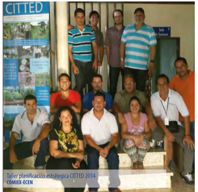
Taller planificación estratégica CITTED 2014 COMIEX-ECEN