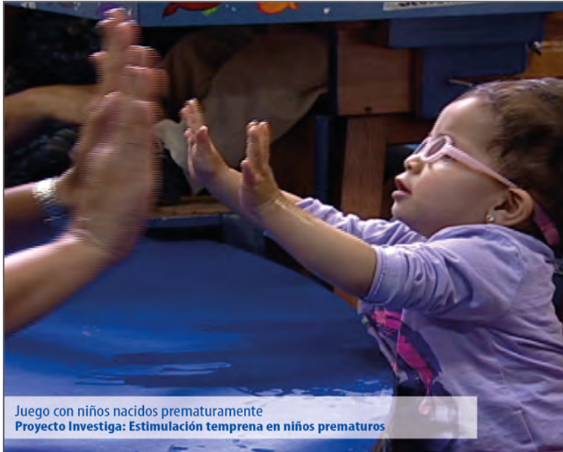
Juego con niños nacidos prematuramente Proyecto Investiga: Estimulación temprana en niños prematuros