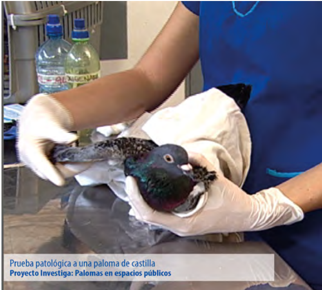
Prueba patológica a una paloma de castilla Proyecto Investiga: Palomas en espacios públicos