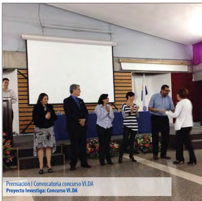
Premiación I Convocatoria concurso VI.DA Proyecto Investiga: Concurso VI.DA