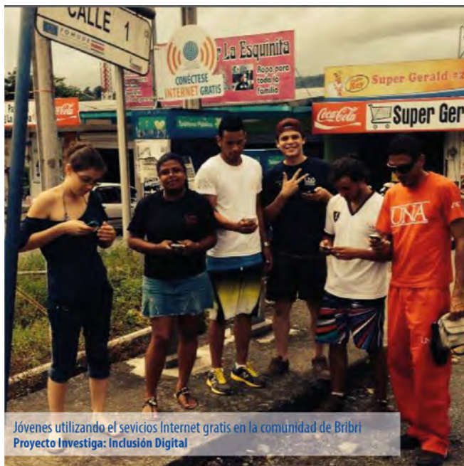
Jóvenes utilizando el servicios Internet gratis en la comunidad de Bribri Proyecto Investiga: Inclusión Digital