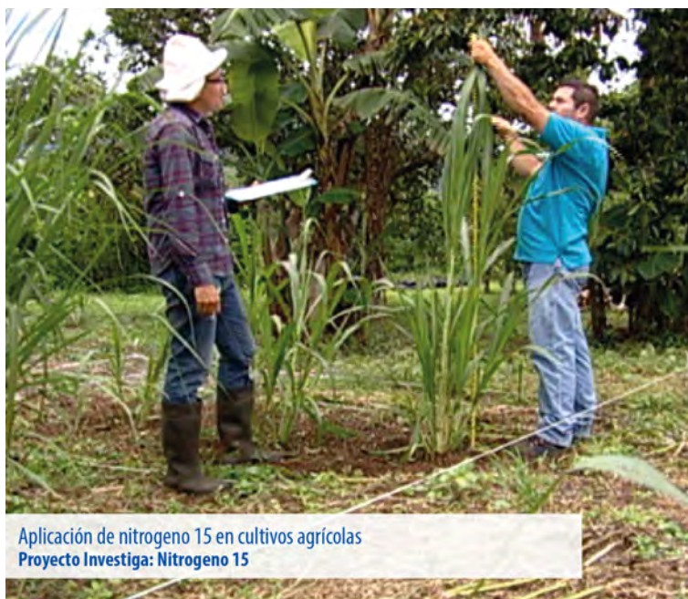
Aplicación de nitrógeno 15 en cultivos agrícolas Proyecto Investiga: Nitrógeno 15