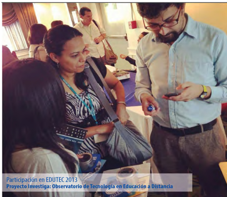
Participación en EDUTEC 2013 Proyecto Investiga: Observatorio de Tecnología en Educación a Distancia