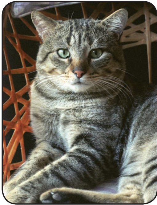
FIGURA 4. El mantenimiento de dos especies introducidas de mamíferos carnívoros como mascotas, los gatos y los perros, tiene un costo ambiental alto.