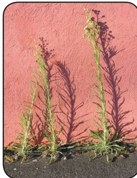
FIGURA 3. En las ciudades por lo general hay escasez de agua, altos niveles de luz, cambios marcados y amplios de temperatura y vientos fuertes, características muy parecidas a las que predominan en claros del bosque, doseles vegetales y zonas semi-desérticas.