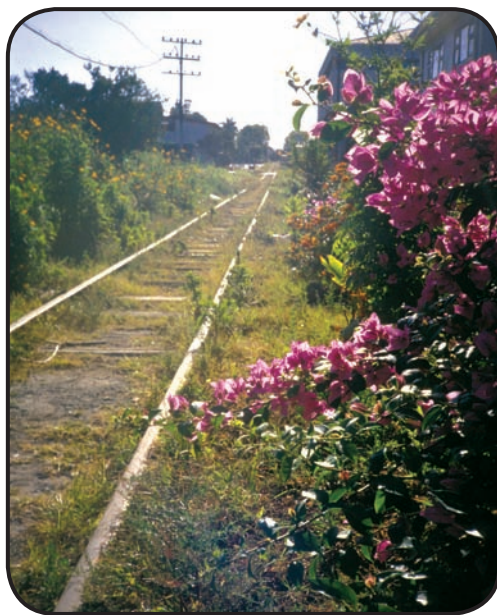
FIGURA 2. Los medios de transporte humano por mar, tierra y aire no solamente abrieron nuevas rutas de dispersión para los organismos, sino que les permitieron viajar a mucha mayor velocidad como polizones o por transporte intencional como cultivos, mascotas y otros. En el siglo XIX, el ferrocarril permitió el transporte rápido de especies biológicas entre la Meseta Central de Costa Rica y las costas.

En un ecosistema urbano se establecen una serie de características, clima, fuentes de alimento y escondrijos, que favorecen a algunas especies más que a otras. En las ciudades por lo general hay escasez de agua, altos niveles de luz, cambios marcados y amplios de temperatura y vientos fuertes, características muy parecidas a las que predominan en claros del bosque, doseles vegetales y zonas semi-desérticas. Consecuentemente, desde África hasta América Latina, son especies de claro del bosque y semidesierto las que predominan en la ciudad (Monge-Nájera et ál., 2010). Esto es particularmente